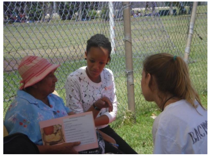
Fiches recettes à gagner après les jeux